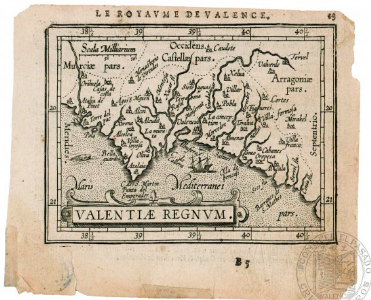
Mapes del Regne de Valencia de Gerhard Kremer i Abraham Oertel