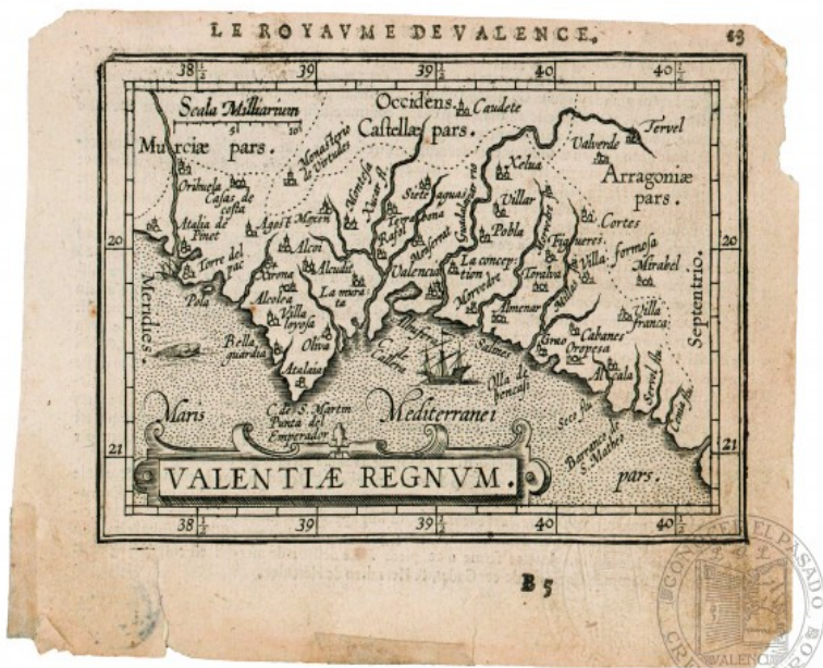
Mapes del Regne de Valencia de Gerhard Kremer i Abraham Oertel