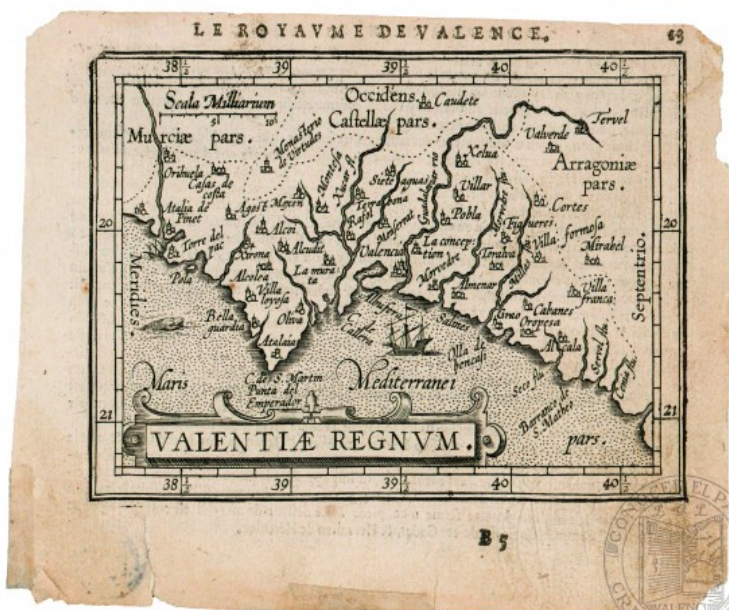
Mapes del Regne de Valencia de Gerhard Kremer i Abraham Oertel